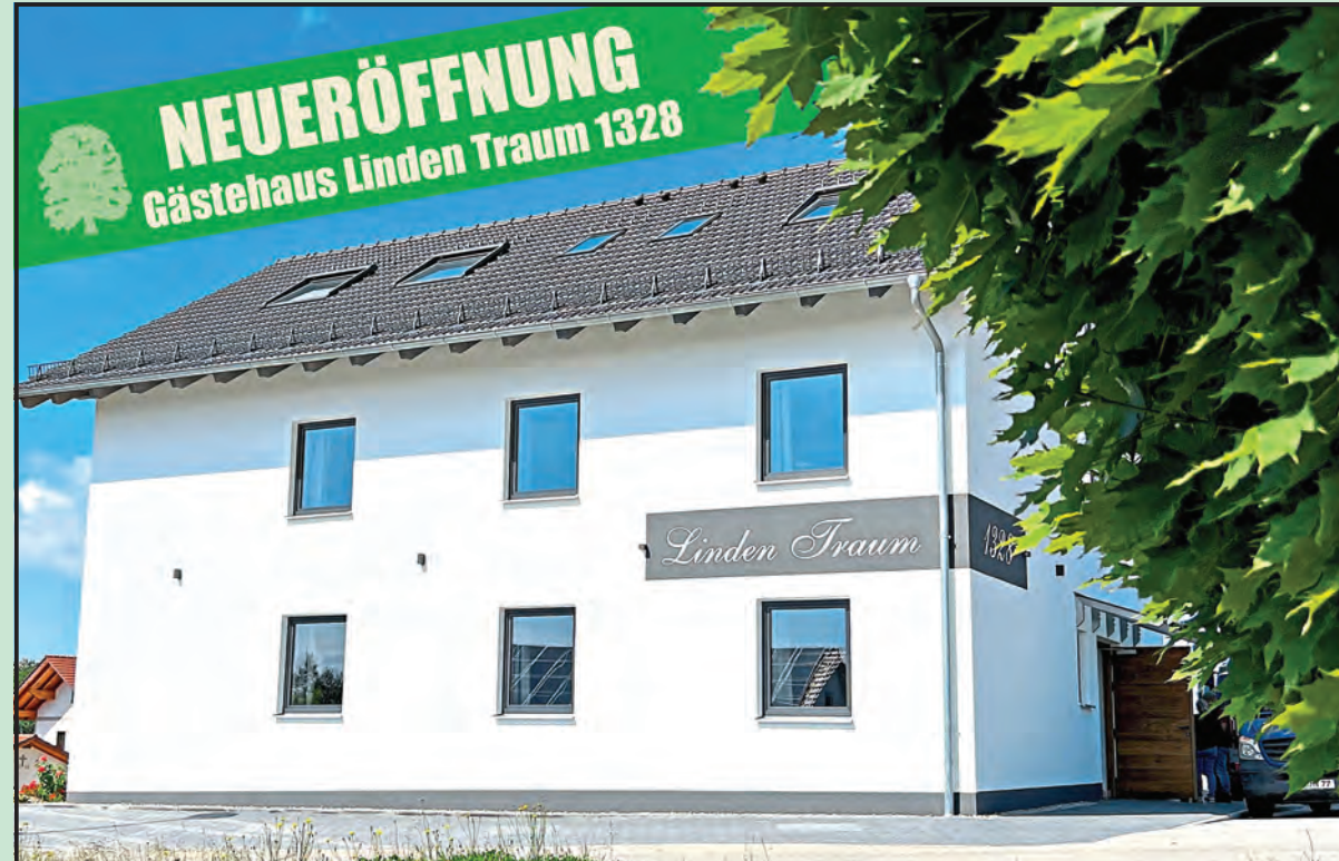
Die urige Holzhaustüre aus der Pleiskirchner Manufaktur Baisl öffnet den Weg in das neue Gästehaus „Linden Traum 1328“ in Wald bei Winhöring. Es beherbergt sieben geschmackvoll eingerichtete Doppelzimmer, ein geräumiges Appartement, eine komfortable Familiensuite und eine luxuriöse Penthouse-Suite.

Überdachte Freifläche mit Alpenpanorama: Auch im Winter ein wunderbarer Ort zum Feiern Ein besonderes Highlight ist die großzügige überdachte Freifläche hinter dem Gasthaus. Hier eröffnet sich den Gästen ein atemberaubender Blick über sanfte Hügel bis hin zur majestätischen Alpenkette. Dieser Ort eignet sich hervorragend für romantische Trauungen unter freiem Himmel oder stimmungsvolle Sektempfänge. Eine imposante