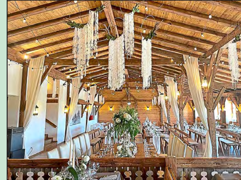
Der „Eventstadl 1328“ mit seinen sichtbaren Holzbalken schafft eine charmante Atmosphäre für Hochzeiten und Feiern aller Art für bis zu 200 Gäste.