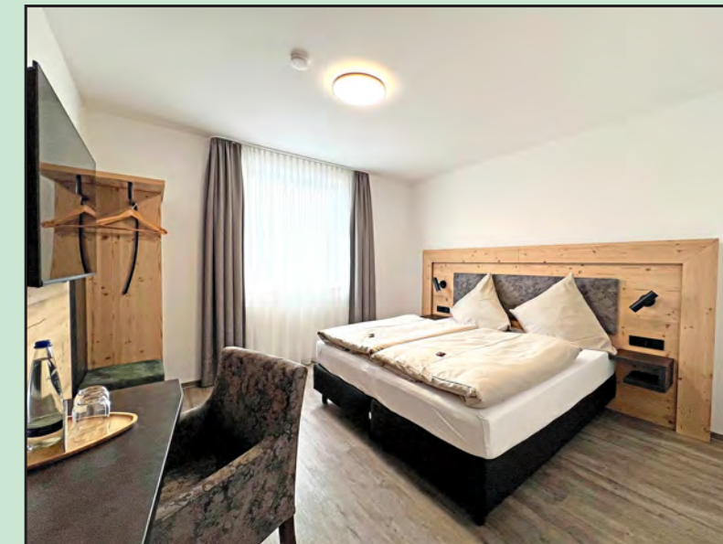
Großzügige Doppelzimmer im modernen Design bieten die ideale Übernachtungsmöglichkeit nach Hochzeiten und anderen Feierlichkeiten.