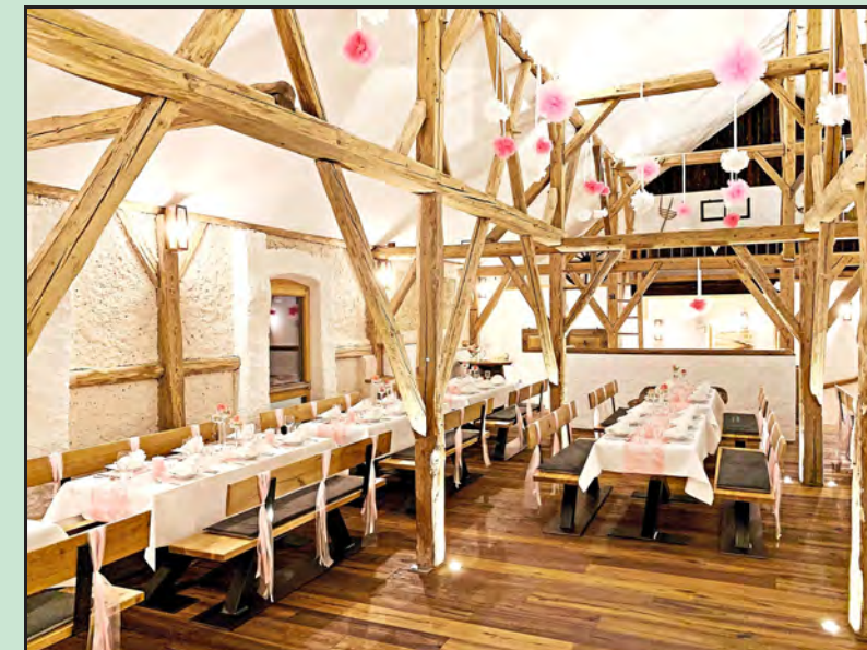
In liebevoller Handarbeit wurde der alte Heustadl in einen modernen Tagungs- und Seminarraum verwandelt, den man auch für Feierlichkeiten nutzen kann.