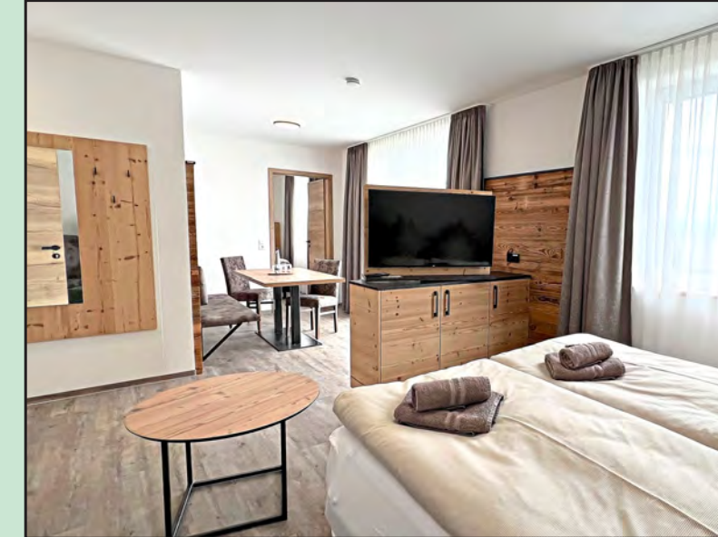
Im Appartement und in den Zimmern des neuen Gästehauses „Linden Traum“ gibt es viele Belegungsmöglichkeiten für Familien, Paare und Einzelpersonen.

Das Landgasthaus zur Linde ist ein Ort, an dem Erinnerungen geschaffen werden. Ob eine romantische Hochzeit mit Blick auf die Alpen, ein produktives Firmenseminar in inspirierender Umgebung, eine gemütliche Weihnachtsfeier in tollem Ambiente oder ein gemütlicher Familienabend im Biergarten oder in der Gewölbebar – hier findet jeder Anlass den perfekten Rahmen.