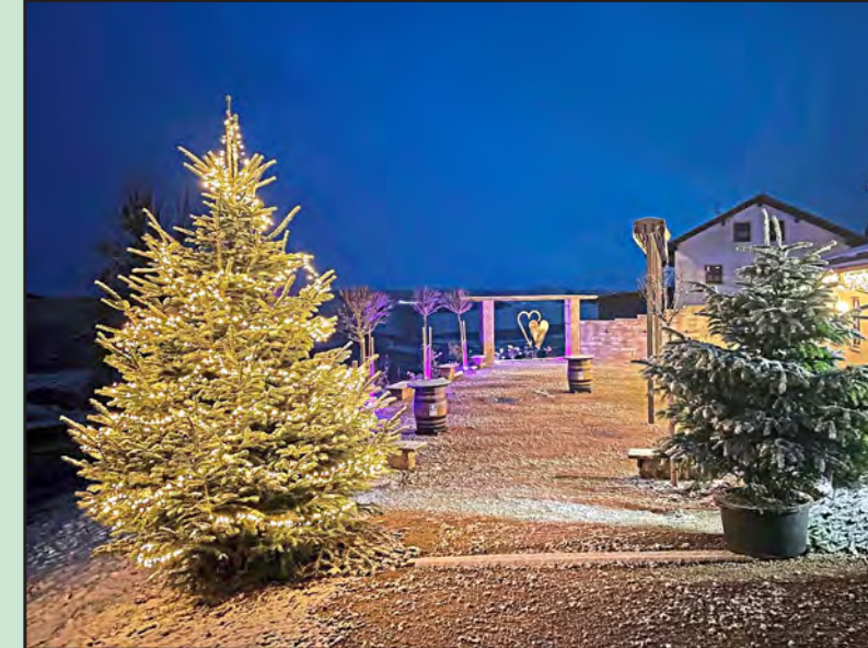
Auch im Winter bietet die wunderbare Freifläche hinter dem Gasthaus viele Möglichkeiten für Empfänge und Veranstaltungen im Freien.